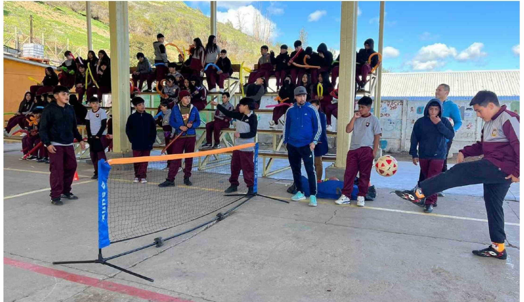
La realización de actividades deportivas también se incluyó en la jornada.

La jornada incluyó una variedad de actividades, entre ellas, baile entretenido, búsqueda del tesoro, el "twister