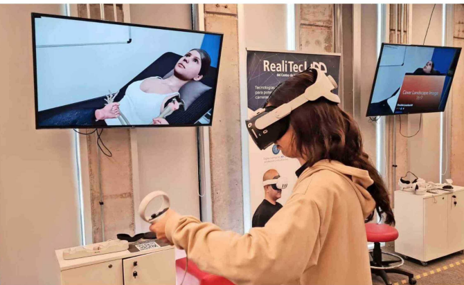
Los alumnos de Medicina de la UDD pueden

ensayar procedimientos, como los que se emplean en el caso de la luxación de un hombro, utilizando la realidad virtual.