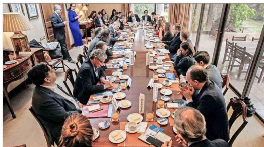
El Consejo Talento Futuro es una iniciativa de la ONG Generation Chile en alianza con Innovación de "El Mercurio", que reúne a representantes del mundo público, privado y académico.

nuevas tecnologías nos han permitido continuar mejorando la propuesta de valor entregada a nuestros clientes".