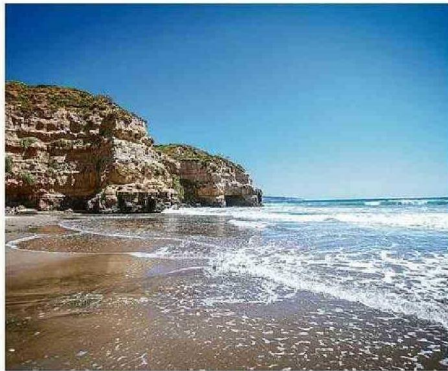
EN LA BASE DEL ACANTILADO DE QUIRILLUCA HAY DOS CAVERNAS.

En el caso particular de la Región de Valparaíso