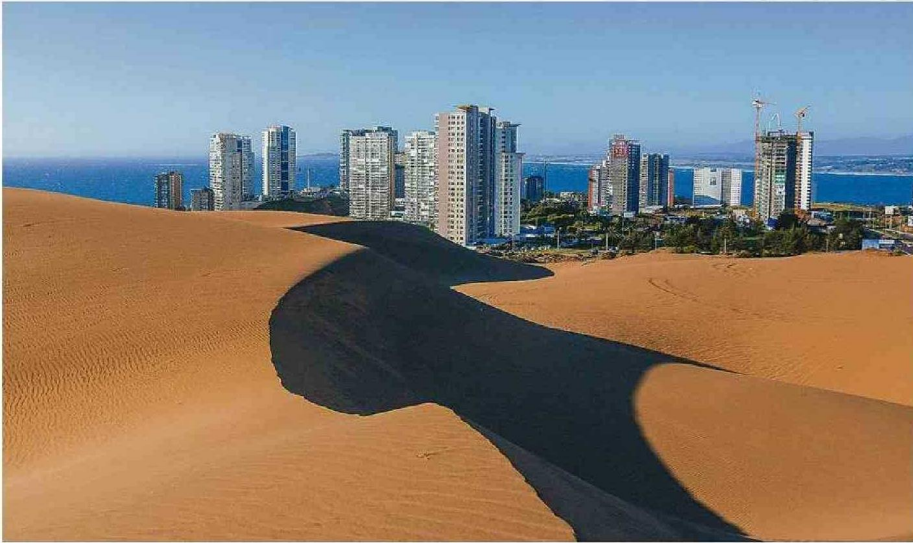
DUNAS DE CONCÓN: AL SER UN CAMPO DE DUNAS FÓSILES SON UNA GEOFORMA NATURAL EXTREMADAMENTE FRÁGIL.