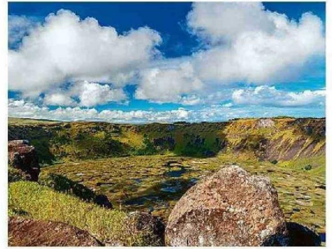
VOLCÁN RANO KAU TIENE DE 900 MIL A 100 MIL AÑOS DE ANTIGÜEDAD.