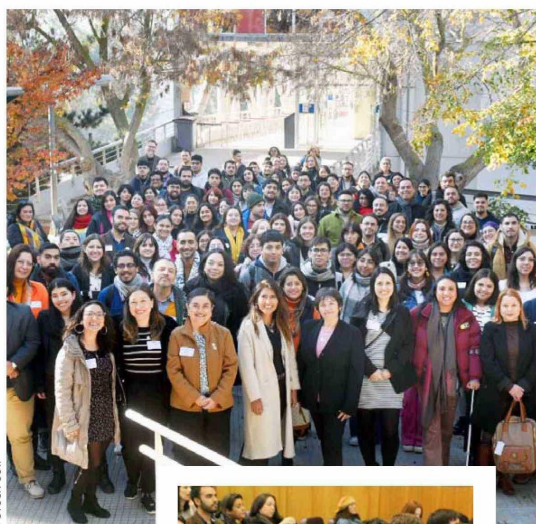
Participantes y autoridades PUCV.

La conferencia por su décimo aniversario contó con el apoyo del Instituto de Literatura y Ciencias del Lenguaje (ILCL), la Dirección General de Asuntos Internacionales (DGAI) de la PUCV y el Ministerio de Educación, a través del programa Inglés Abre Puertas (PIAP).