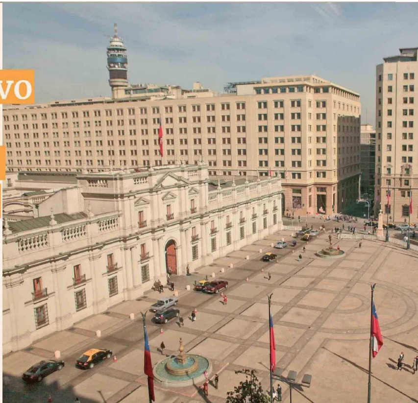
RESULTADO EFECTIVO DEL GOBIERNO CENTRAL

“Los ingresos proyectados para este año, basados en una estimación excesivamente optimista para 2024, tienen el mismo problema de sobrestimación, y si no se corrige el gasto con un ajuste bastante más significativo que el anunciado, la estimación de déficit para este año tampoco se cumplirá”, anticipa.