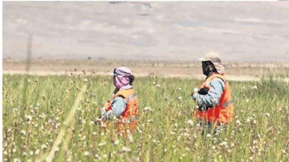
EL SALAR DE ATACAMA, ADEMÁS DE CONTENER EL 27% DE LAS RESERVAS DE LITIO, ES UNA ZONA DE GRAN SENSIBILIDAD DADA SU BIODIVERSIDAD.

"Esta iniciativa de Albemarle incluye un vivero de alta tecnología, que fue diseñado, construido e implementado