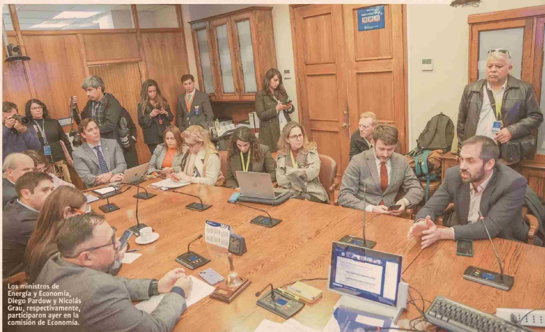
Los ministros de Energía y Economía, Diego Pardow y Nicolás Grau, respectivamente, participaron ayer en la comisión de Economía.

Consultado, el presidente de la comisión de Minería y Energía del Senado, Juan Luis Castro, quien además dirige la mesa técnica, señaló: “Los cálculos hay que hacerlos con