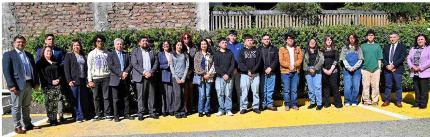
ALUMNOS DE ESTABLECIMIENTOS PÚBLICOS QUE FUERON DESTACADOS POR EL SERVICIO LOCAL DE EDUCACIÓN PÚBLICA 8SLEP.