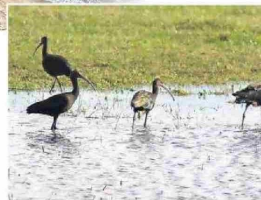
Diversas especies endémicas están presentes.

Zona de borde costero: corresponde a la concesión marítima. Se puede instalar equipamiento deportivo con enfoque en deportes náuticos.