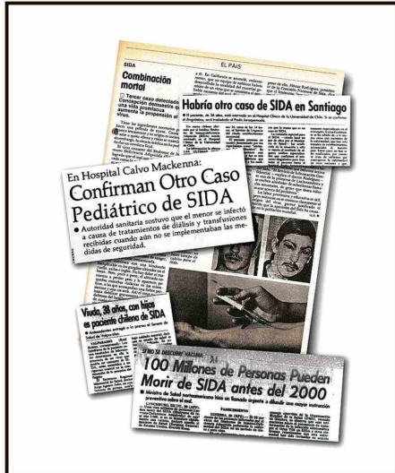
DURANTE LOS PRIMEROS AÑOS LA PREOCUPACIÓN ERA MAYOR QUE AHORA.

“En toda ocasión hay que usar preservativo, hay que tener prácticas sexuales seguras”, afirma. “Pero eso se adquiere a través de la educación desde la infancia, desde la escuela básica. Deberíamos tener educación sexual que permita generar una cultura sexual y de prácticas sexuales seguras para hombres, mujeres heterosexuales, homosexuales, las categorías que sean. Lo que va a resolver esto en el largo, mediano plazo es una política integral al respecto”.