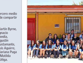
Alumnos del Colegio San Miguel Arcángel en la escuela de Guayacán, Cabildo.