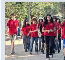
Parte del grupo de estudiantes misionando en Pomaire.