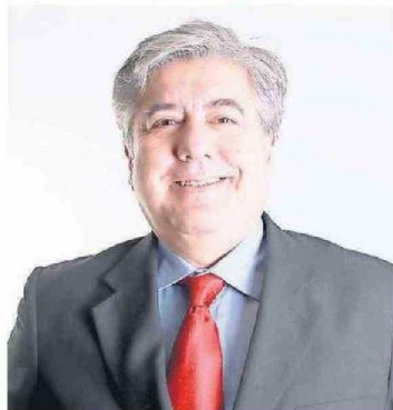
Sergio Morales, presidente del Consejo de Rectores Vertebral.

Por último, la colaboración con el sector productivo se intensificará, asegurando que los programas educativos estén alineados con las necesidades reales de las distintas áreas productivas. Esto implicará la masificación de programas de formación dual, donde los estudiantes alternen entre la formación en el aula y la práctica en empresas, asegurando una transición más fluida al mundo laboral.