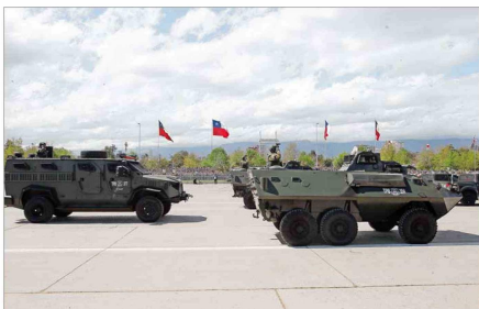
Los vehículos especiales de Carabineros con los que cuentan las unidades destinadas al control del orden en la macrozona sur estuvieron entre las novedades.