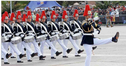
El tambor mayor y la banda de la Escuela Militar del Ejército , dando inicio con gallardía al desfile en el Parque O'Higgins.