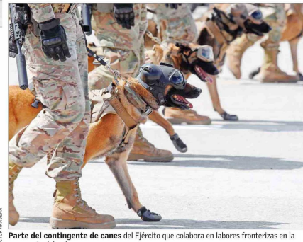
Parte del contingente de canes del Ejército que colabora en labores fronterizas en la zona norte del país.