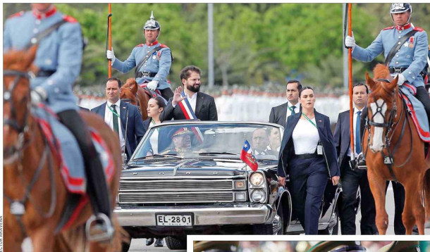
A bordo del tradicional Ford Galaxie, el Presidente Gabriel Boric llegó a su tercera Parada Militar, en compañía de la ministra de Defensa, Maya Fernández, para luego reunirse con autoridades de las Fuerzas Armadas y de los demás poderes del Estado. El mandatario también estuvo acompañado por uno de sus sobrinos.

"Trabajaré hasta el último segundo, hasta el último minuto, la última hora del último día", señaló.