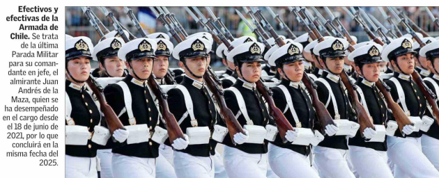
Efectivos y efectivas de la Armada de Chile. Se trata de la última Parada Militar para su comandante en jefe, el almirante Juan Andrés de la Maza, quien se ha desempeñado en el cargo desde el 18 de junio de 2021, por lo que concluirá en la misma fecha del 2025.