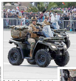
Inclusión femenina en la Brigada de Operaciones Especiales del Ejército fue destacada.