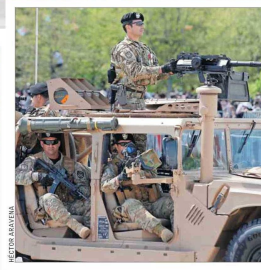
Los vehículos Humvee del Ejército , diseñados para tareas de exploración, traslado de tropas y patrullajes de largo alcance, entre otras tareas.