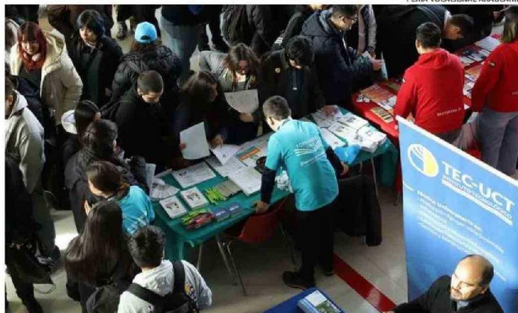
LA FERIA CONTÓ CON STANDS CON INFORMACIÓN DE UNIVERSIDADES, INSTITUTOS PROFESIONALES (IP) Y CENTROS DE FORMACIÓN TÉCNICA (CFT), SUS CARRERAS, LAS ESPECIALIDADES Y REQUISITOS DE INGRESO.

Asimismo, se realizaron charlas temáticas, entre ellas “Qué necesitas para transformar el