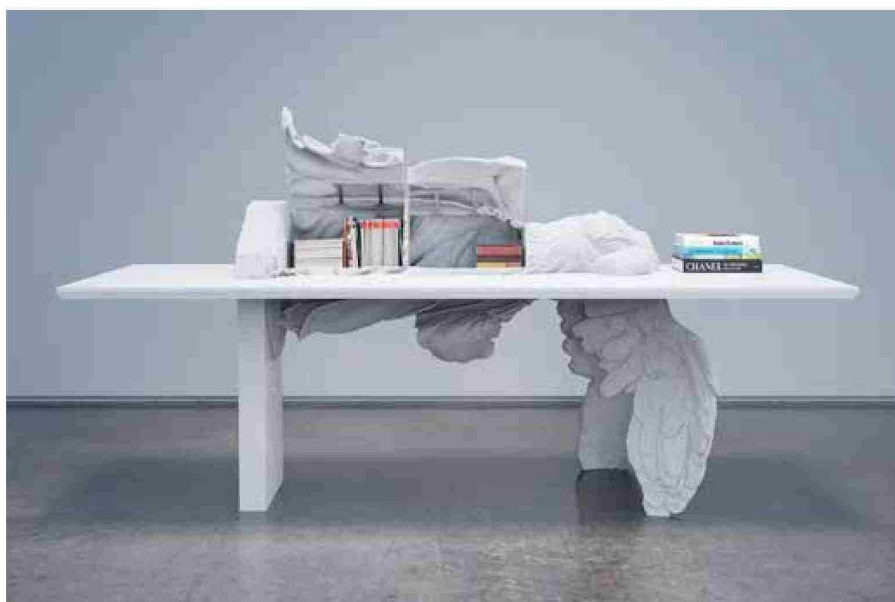
«Winged Victory Desk» (2022).

Utilizando las modeladoras 3D, este consagrado transforma estatuas de la antigüedad con rostros de dirigentes políticos, a héroes y villanos, como Donald Trump, Elon Musk, Steve Jobs y Mark Zuckerberg. Trabaja con la madera para crear mesas que parecen estar en la tormenta de un bosque, bibliotecas con formas de árboles. Y se apropia de pájaros disecados para incluirlos en sus diseños de objetos utilitarios, como espejos o lámparas.