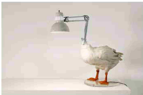
«The Duck Lamp» (2004)