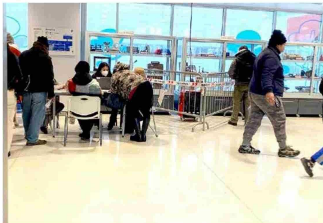
Quienes han acudido al recinto durante los últimos días, han notado el frío que se siente dentro del Hospital.

Por ello, Canteros entregó el siguiente mensaje a la comunidad: “Paciencia, eso se va a resolver, es un tema para nosotros importante, que nos genera incomodidad y frustración, pero aquello va a ser resuelto a la brevedad”, cerró.