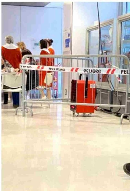
La falla no permite que el sistema de climatización pueda abarcar todos los rincones del nuevo edificio del Hospital de Curicó. En tal contexto, se han tomado medidas provisorias, de cara a lo que debe ser la “solución definitiva”.

Las áreas de pacientes hospitalizados como urgencia, pabellón, parto, entre otras, están cubiertas, mientras que la atención ambulatoria y sobre todo los sectores donde trabaja la mayoría de los funcionarios, y por ende, acude la mayor cantidad público, por ahora tendrán que seguir esperan-