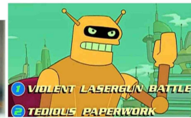
En "Futurama", la audiencia podía incidir en la trama de la película del robot Calculón (arriba). Varios años después, Netflix propuso algo similar en su serie "Black Mirror" (foto izquierda).

Gregorio-Monsalvo dice que con el radiotelescopio y su interferómetro, en ALMA también se puede saber cómo huelen los planetas bebés o recién formados, ya que se puede determinar la composición de los gases que están en tomo a ellos.