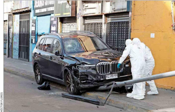
Al menos $100 millones en efectivo fueron robados de comerciantes chinos que se desplazaban en un auto blindado por el barrio Meiggs. Se investiga si delinquentes estaban “dateados” al respecto.

Para Vidal, “hay un segmento de la sociedad chilena que a partir de ver un riesgo mayor en sus desplazamientos, en sus lugares de trabajo o vivienda ha optado por el blindaje de un vehículo. También hay muchos que han desarrollado proyectos arquitectónicos vinculados a medidas de seguridad, de blindaje. No es tan ajeno ver instalaciones que no necesariamente uno podría creer que van a blindar una determinada dependencia, hoy día la tienen”.