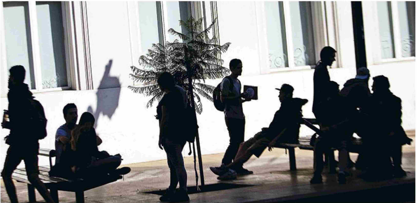
► El pago se comenzará a realizar un año después de que el solicitante ingrese al mundo laboral.