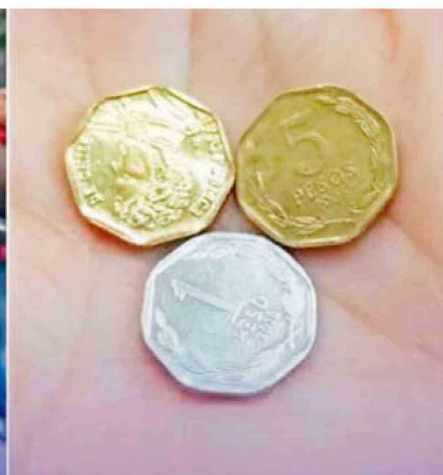
Los pagos a 156 cuotas de lo adeudado por las isapres a sus afiliados generaron enojo en la ciudadanía.