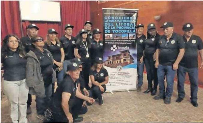
LOS INTEGRANTES DE LA AGRUPACIÓN SOL Y DESIERTO DE TOCOPILLA.