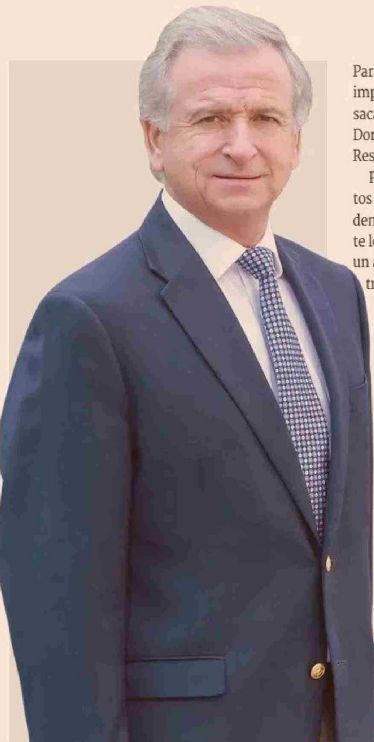
FELIPE LARRAÍN EXMINISTRO DE HACIENDA (2010-2014 Y 2018-2019). PROFESOR TITULAR ECONOMÍA UC DIRECTOR CLAPES UC.

A ello se suma la creación de un millón de empleos en momentos llenos de dificultades producto de la fuerte desviación de recursos destinados para la reconstrucción del país, tras el terremoto del 27 de febrero de 2010. El costo para la economía nacional del desastre natural fue cerca de US$ 30.000 millones, un 15% del PIB de la época.