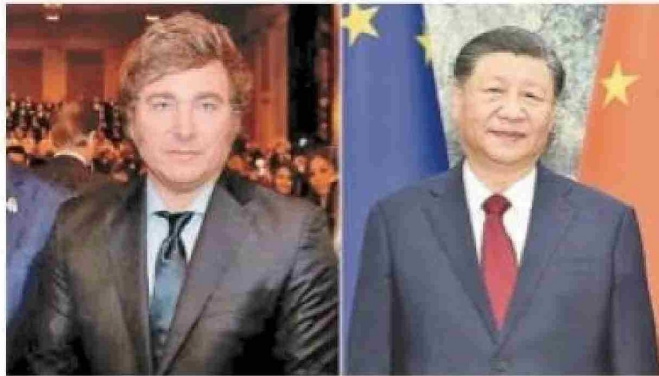
Javier Milei y Xi Jinping iniciaron un acercamiento diplomático en base a posibles inversiones chinas en litio y cobre.

El swap se debe renovar en junio de 2025, y además Argentina debe acceder a inversiones directas para salir de la crisis y abrir el cepo financiero. Desde esta perspectiva, se abrió un inédito capítulo diplomático que se hizo público