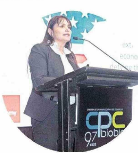
La destacada economista Michéle Labbé fue la encargada de exponer en la actividad.