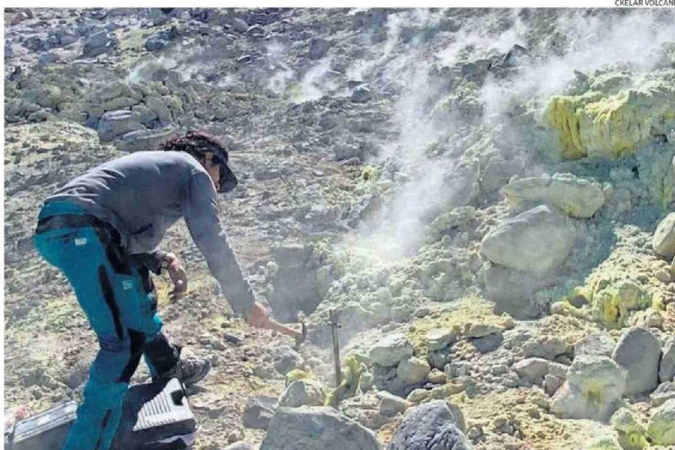
UNO DE LOS VOLCANÓLOGOS RECOLECTANDO MUESTRAS DE LAS FUMAROLAS DE LOS VOLCANES PARA SU POSTERIOR ANÁLISIS.

INSTITUTO MILENIO CKELAR. Se trata de un estudio inédito de muestreo de gases y aguas en 13 volcanes ubicados desde la Región de Arica y Parinacota, hasta la Región de Atacama. Muchos de ellos, nunca antes analizados.