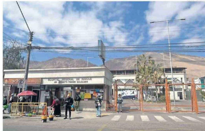
FUNCIONARIOS MÉDICOS DEL HOSPITAL DE IQUIQUE CRITICAN EL FUNCIONAMIENTO DE LA RED.

"La gestión de la directora de salud se lo hicimos saber y no nos convence, porque hemos tenido tres reu-