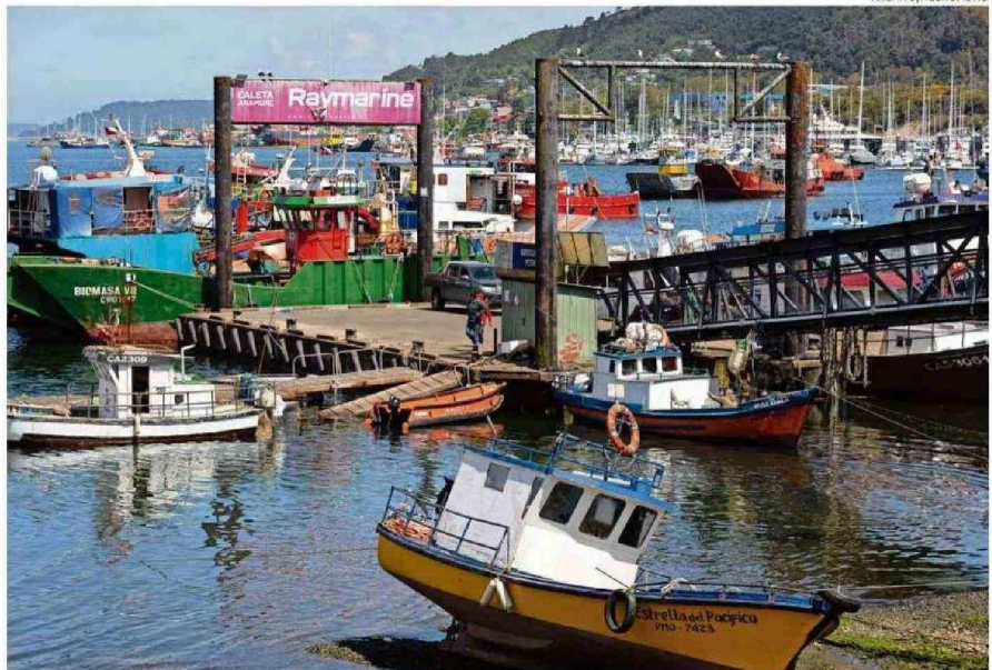
LA ACTIVIDAD DE LA INDUSTRIA ACUÍCOLA Y PESQUERA FUE RELEVANTE PARA ALCANZAR ESTE NIVEL DE DESARROLLO ECONÓMICO EN LOS LAGOS.