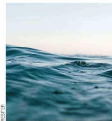
La tecnología permite obtener recursos libres de contaminantes, como agua limpia, arena tratada y residuos de hidrocarburos recuperados.

• Recuperación de suelos: La arena tratada es almacenada en estanques y se transporta para su uso en la rehabilitación de áreas