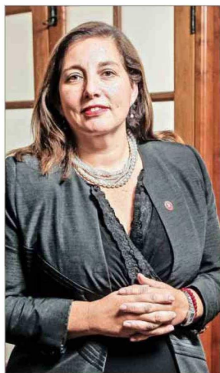
La senadora Paulina Vodanovic (PS) buscará la reelección.