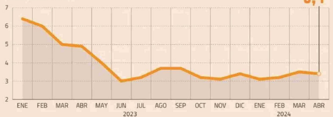
INFLACIÓN SUBYACENTE EN ESTADOS UNIDOS