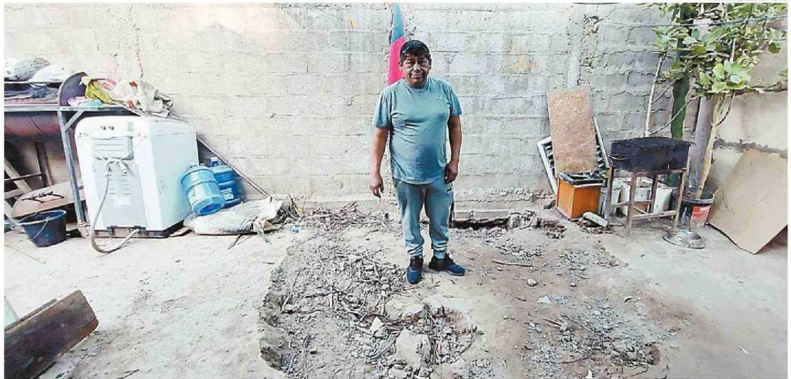
EN TIERRA AMARILLA EXISTE UNA PROFUNDA PREOCUPACIÓN EN LA COMUNIDAD ANTE EL TEMOR DE LA APARICIÓN DE NUEVOS SOCACIONES. HACE DÉCADAS QUE APARECEN EN LA COMUNA.