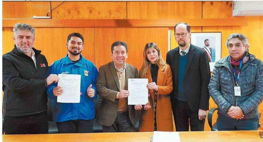
EN EL GOBIERNO REGIONAL SE CONCRETÓ LA FIRMA.

“Como comunidad nosotros queremos salir de la duda y dormir tranquilos. Todavía hay mucho temor de que ocurra otro socavón”