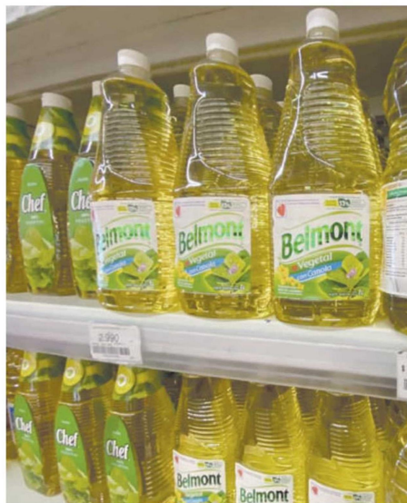
La inflación ya se empieza a sentir en los bolsillos. El precio del aceite es uno de los síntomas más evidentes.

cuando se estimaba que sería de un 1%. En lo que va del año esa cifra llega al 4,8%, y el alza en doce meses seguidos alcanzó el 10,5%. Ese es el primer registro de dos dígitos en casi 30 años, cuando en 1994 se llegó al 11,2%.