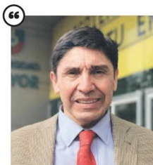
"Están las condiciones para hablar de estanflación en Chile, algo que también se vive en Estados Unidos"

"Según la definición clásica de la estanflación, Chile probablemente ya está entrando en ese proceso, porque los números indican que la inflación acumulada va ya alrededor del 10% y el crecimiento asoma bajo. A nivel externo nos perjudica la guerra entre Rusia y Ucrania, que ha hecho