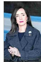
"Ningún país colonialista nos va a amenazar", afirma la vicepresidenta Victoria Villarruel.

Richter alcanzó el fuerte sismo que remeció anoche la zona norte, cuyo epicentro se situó a 20 kilómetros al sur de San Pedro de Atacama. | C 11