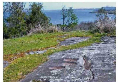
LAS PIEDRAS TACITA ENCONTRADAS EN EL SITIO JUNTO A LA PIEDRA ANTÜKURA.