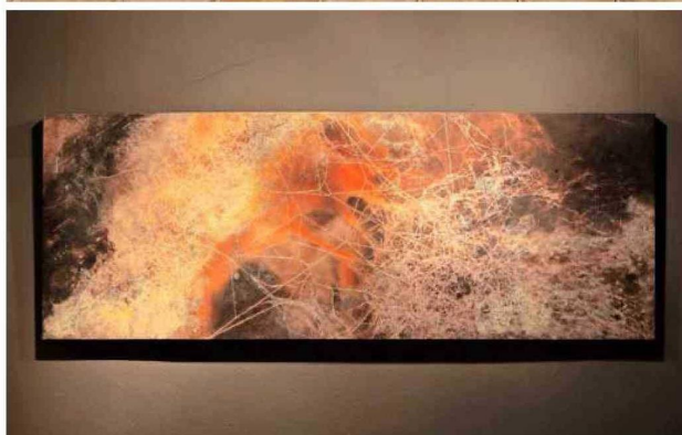
Para este trabajo, Lira también hizo una reflexión sobre la escasez de alimentos por falta de tierras para el cultivo.