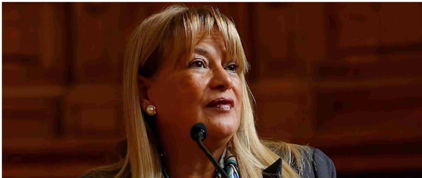
► Hace una semana que se anunció la apertura de un cuaderno de remoción en contra de la ministra Ángela Vivanco.