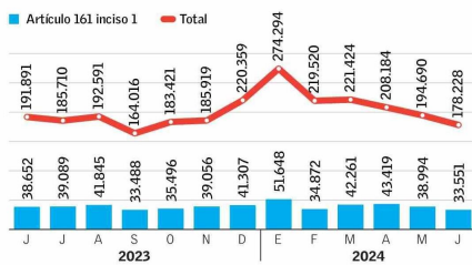
Trabajadores involucrados con un único empleador en cartas de aviso de término de contrato

El análisis del director del Observatorio del Contexto Económico (Ocec) de la Universidad Diego Portales (UDP), Juan Bravo, apunta a que la cifra de junio