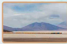
Salar de Ascotán

Además, la ministra Etcheverry remarcó que "la experiencia de las empresas dentro de la cadena de valor del litio es esencial, y por eso hemos incorporado las capacidades tecnológicas que estas poseen en esta decisión".