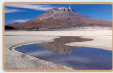
Región de Antofagasta Salar de Ascotán Salar de Ollagüe