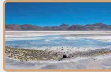
Región de Atacama Laguna Verde Salar de Agua Amarga Salar de Piedra Parada