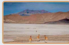
Región de Tarapacá Salar de Coipasa