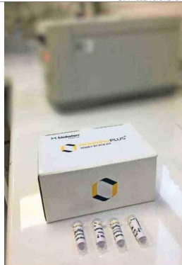
Honning Plus es un PCR similar a los para detectar el covid-19.