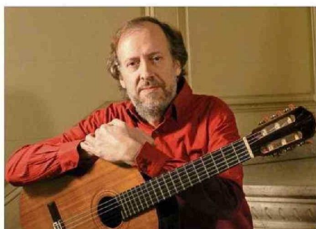
LUIS ORLANDINI (2013).

Homenajeamos a un músico que ha llevado a la patria a lo más alto del arte mundial. Su voluntad y nobleza lo hacen merecedor indiscutido del Premio Nacional de Artes Musicales 2024.