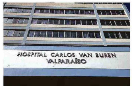
INDICACIÓN MÉDICA HABÍA SIDO CURSADA EL 20 DE DICIEMBRE.