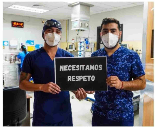
LOS PROPIOS FUNCIONARIOS de la salud han hecho campañas para concientizar por el respeto a su trabajo.

Sin embargo, la situación en la Urgencia presenta un panorama distinto. En 2021 sólo hubo un caso reportado en dicha unidad, pero la cifra ascendió a tres en 2022, 27 en 2023 y 22 en 2024. Pese a la leve merma de casos durante el año pasado, esto refleja una tendencia al alza en la violencia dentro de este servicio crítico.