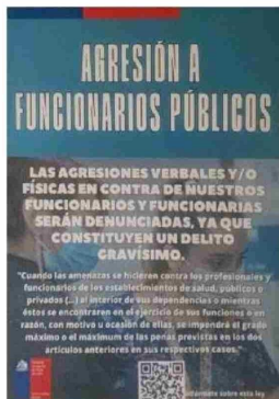
LOS AFICHES DISTRIBUIDOS en distintos puntos del hospital advierten que las agresiones físicas y verbales pueden tener condena legal.