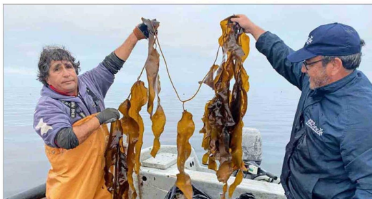
Cosecha de algas marinas para la creación de biocarbón.

Actualmente, la iniciativa se encuentra en una fase crucial de análisis. Los estudios incluyen la certificación para la generación de créditos de carbono y la evaluación de nuevas aplicaciones de los productos derivados de las algas. "Nuestra meta es demostrar que estos cultivos pueden escalarse y convertirse en una solución efectiva para la mitigación del cambio climático, beneficiando al mismo tiempo a las comunidades locales", concluye Girardi.