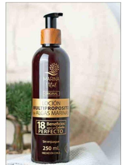
Loción multipropósito de algas marinas, el producto central de Marina Vital.