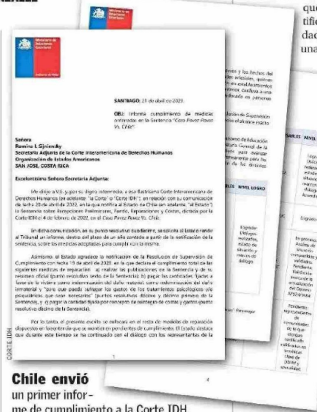
Chile envió un primer informe de cumplimiento a la Corte IDH.

Representantes de la Conferencia Episcopal presentaron un documento para explicar estos puntos, que luego respaldó, el pasado 8 de agosto, el Comité Nacional de Educación Evangélica, organización que reúne a más de 1.500 profesores a lo largo del país y que está a cargo de los programas de religión a los que adhieren las distintas corrientes evangélicas