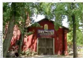
COLONIAL. La capilla está en la única plaza chilena que, dicen, mantiene su diseño histórico.

El británico se interesó por el espacio desde niño, en Inglaterra, al punto que a