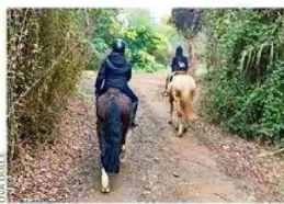
UVA DULCE. En Tunca Arriba se ubica esta granja educativa y bed & breakfast.

Con arquitectura centenaria, típica del Valle Central, esta aldea es una de las más antiguas de la comuna de San Vicente de Tagua Tagua. Declarada Zona Típica en 2005, debe su origen a una capilla del siglo XVIII que aún se puede ver, aunque hay mucho más aquí y en los alrededores. por Francia Fernández.