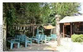
ACOGEDOR. La entrada al quincho de Uva Dulce: un buen sitio para hacer una pausa con un café.