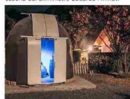
OBSERVATORIO TAGUA TAGUA. Mezcla astronomía y vinos. En los domos proyectan material didáctico 3D de elaboración propia.

los 7 años fabricó su primer telescopio. En 2014 montó el primer observatorio móvil en Chile, y ahora espera con su esposa replicar la experiencia del Observatorio Tagua Tagua en Mendoza, donde residen con sus hijos.