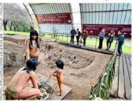
RECREACIÓN. Una familia indígena en Cuchipuy, el sitio arqueológico más antiguo del Valle Central.

Para Montero, en todo caso, la plaza lo-