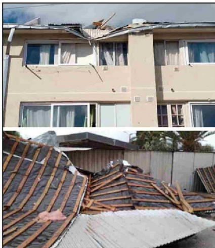
Residentes de los departamentos Sargento Aldea fueron de los más afectados al perder la techumbre y dejar a varias familias soportando a la intemperie la intensa lluvia que vino después del viento.

Asimismo, expresaron que «lamentamos los inconvenientes que esta situación ha provocado en la vida de nuestros clientes y seguiremos trabajando hasta permitir la restitución total del servicio, la cual podría extenderse hasta la jornada del martes 06 de agosto».