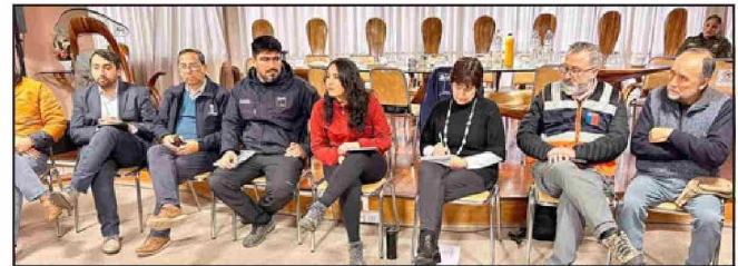
Delegada Regional encabezó reunión por crisis eléctrica en Aconcagua.

En cuanto a los APR y los problemas que se les ha generado, además, para el abastecimiento de agua a las familias que dependen de este servicio, es que se ha coordinado apoyar con la entrega de pe-