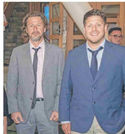
© Antonio Perocarpi , director de revista Tell Magazine, y Franco Perocarpi .