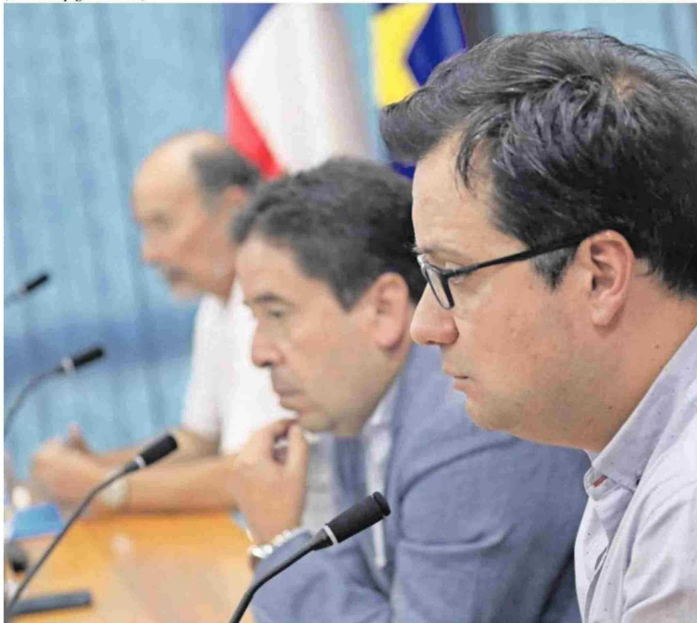
VARGAS DEFIENDE EL PLAN DE DESCENTRALIZACIÓN Y BARRIONUEVO, SI BIEN LO COMPARTE TAMBIÉN, CREE QUE SE DEBE VER EN EL MEDIANO Y LARGO PLAZO.

que es una medida que a futuro podría ser implementada.