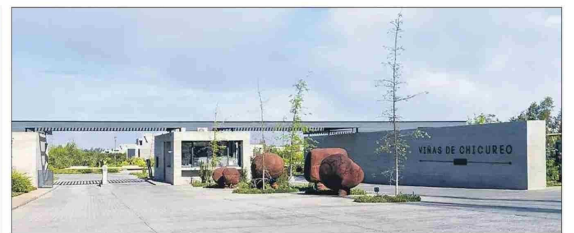
El complejo habitacional tiene altos estándares de seguridad.

“Los proyectos de Gonzalo Mardones son de reconocida calidad arquitectónica. El diseño de espacios y detalles fomentan que el habitar sus obras sea una gran y grata experiencia”, admite.