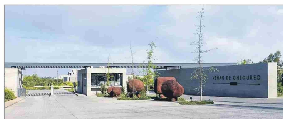
El complejo habitacional tiene altos estándares de seguridad.

“Corresponde a un tipo de acabado en el cual la estructura se convierte en la terminación misma. Su aspecto depende del cemento, tipo de áridos, pigmentos y moldajes. Es un revestimiento noble, de gran durabilidad y poca mantenimiento. Su coste es elevado, ya que requiere de ma-